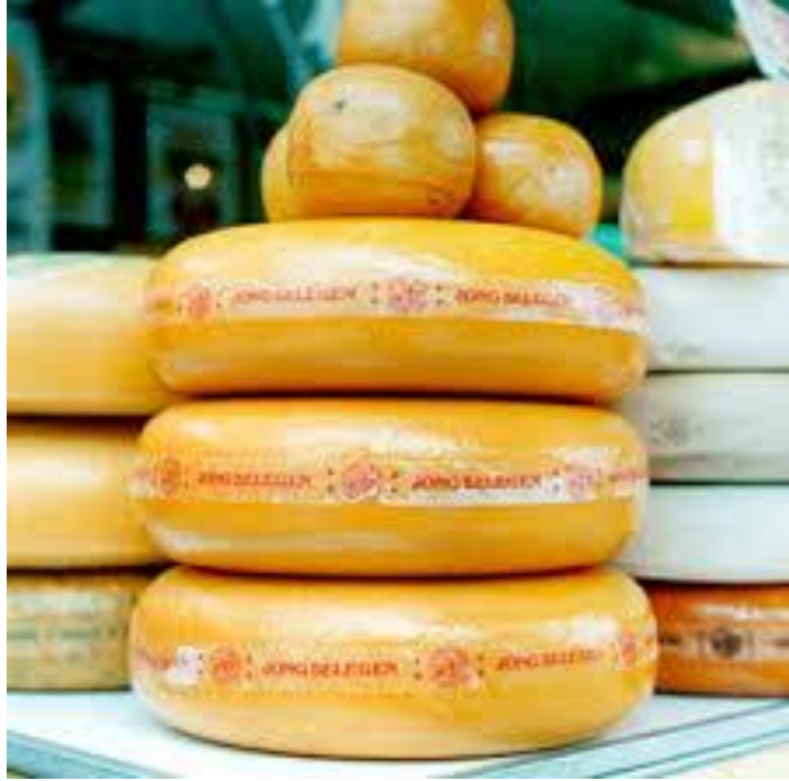
Queso de Gouda ( Goudakaas ).