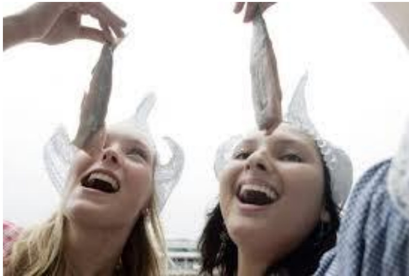
Arenques ( Haring ).